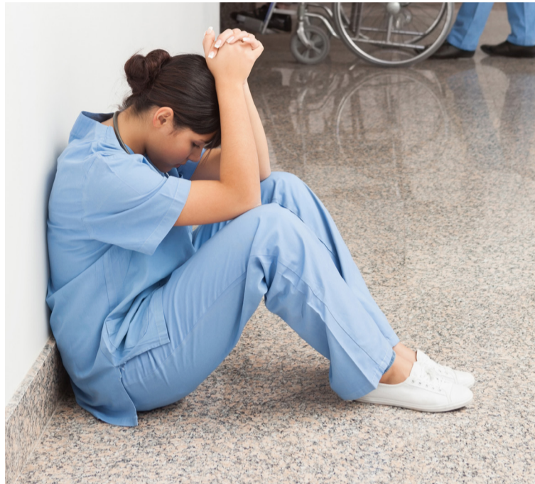
Las agresiones a profesionales son un problema recurrente que va en aumento

Además de campañas de sensibilización que recuerden que los profesionales sanitarios son autoridad pública, o medidas como un aumento del número de vigilantes en los servicios donde más agresiones se producen y un incremento de las penas, SATSE recuerda que la asistencia sanitaria debe contar con suficientes