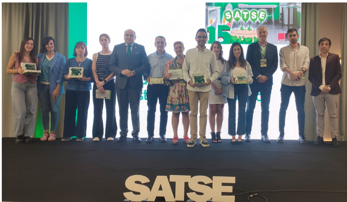
Enfermeras y enfermeros galardonados en el XV Congreso de Investigación de SATSE Ciudad Real

PROTECCIÓN DE DATOS | A efectos del Reglamento Europeo de Protección de Datos, le informamos de que SATSE, en su condición de editor de medios impresos y electrónicos, así como las empresas que colaboran en las labores de edición, publicación y distribución, tratan datos personales con la finalidad de divulgar información de interés para la profesión enfermera y sus afiliados/as. MUNDO SANITARIO y los boletines digitales se editan, publican y distribuyen en el ámbito de las actividades legítimas de SATSE. Los titulares de datos personales pueden ejercer los derechos de acceso, rectificación, supresión, revocación del consentimiento, así como el resto de derechos en la siguiente dirección electrónica: equipo-dpd@satse.es Alternativamente, puede dirigirse al delegado de protección de datos de SATSE a través de privacidad-dpd@satse.es Más información sobre nuestra política de protección de datos en www.satse.es/aviso/politica-de-proteccion-de-datos-de-satse .