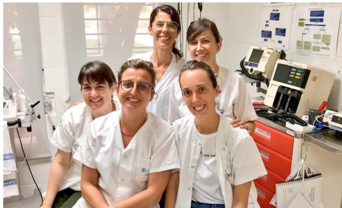
El trabajo de las enfermeras vuelve a ser muy bien valorado por el conjunto de la sociedad

La encuesta también se interesa por la confianza y seguridad que transmiten las profesionales de Enfermería que trabajan en los centros de salud y, en este caso, la nota también supera el 8.