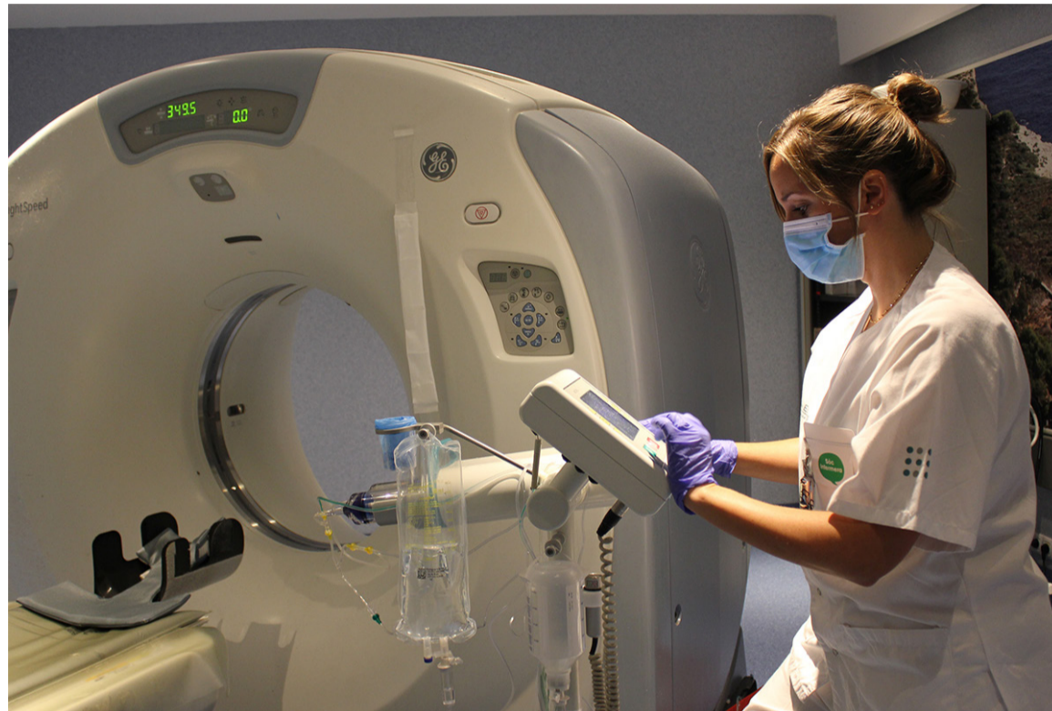
SATSE reclama un conocimiento detallado del número de profesionales existente en el SNS

El Sindicato entiende que esta falta de transparencia informativa en materia de recursos humanos puede deberse al interés de las administraciones públicas porque no haya una radiografía actualizada y veraz que advierta, con datos detallados, sobre la fal-