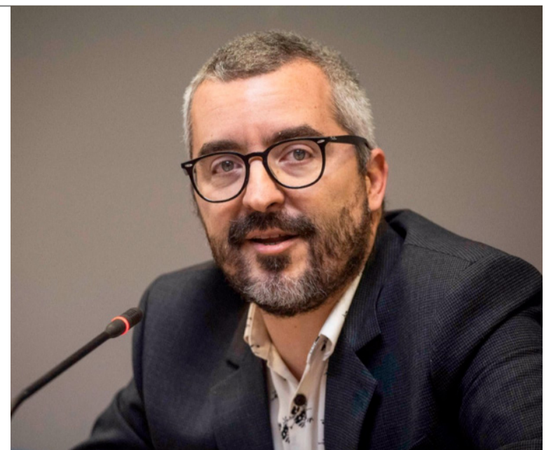
El secretario de Estado de Sanidad, Javier Padilla

Según SATSE y CESM, es injustificable que el Gobierno mantenga este recorte salarial cuando, según él mismo reconoce, la crisis económica que lo motivó se superó en 2014 y, desde entonces, la situación económica ha experimentado una fase de crecimiento permanente. ■