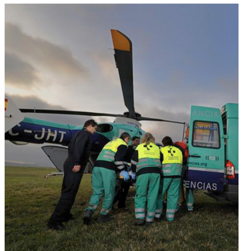
Personal del Servicio de Emergencias de Osakidetza

“Nos hemos dirigido a Osakidetza y Ayuntamiento y, gracias a nuestras peticiones, por fin están realizando una inspección para valorar la situación”, concluyen la organización sindical. ■