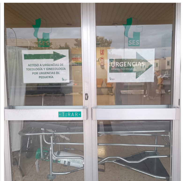
Puerta del Hospital Materno Infantil de Badajoz