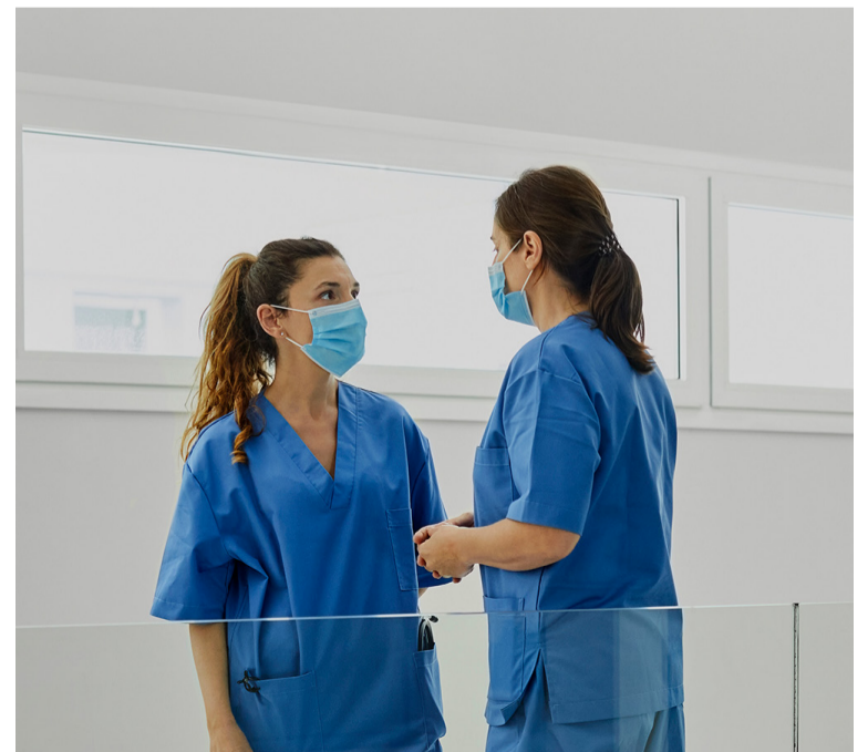
SATSE reclama priorizar la atención y cuidado de la salud mental de las enfermeras

Según SATSE, la salud mental de estas profesionales "se ha dejado de lado" y, por ello, los servicios de prevención de riesgos laborales se han centrado fundamentalmente en los riesgos físicos en el desempeño del trabajo y no han tenido prácticamente en cuenta los psicosociales.■