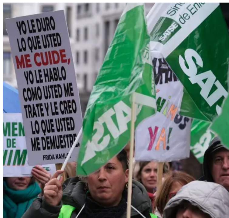
Una de las concentraciones impulsadas por SATSE en defensa de los profesionales

"Gracias a estos resultados las necesidades de nuestras profesiones continuarán presentes