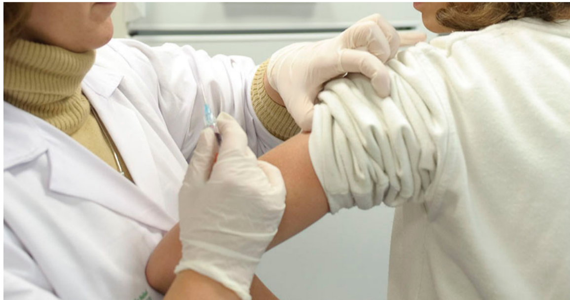
La enfermera es la profesional sanitaria responsable del proceso de vacunación a la población

El Sindicato lleva años reclamando un Plan de Vacunación acorde con los recursos humanos existentes.