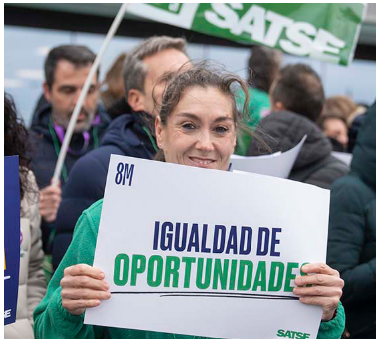
Concentración de SATSE con motivo del Día Internacional de la Mujer

Al respecto, la Organización Mundial de la Salud apunta que la devaluación de los cuidados tiene un impacto negativo en los salarios, las condiciones laborales, la productividad y la huella económica del sector sanitario.