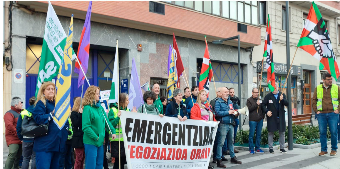
Protesta de los profesionales para denunciar su situación y reivindicar una condiciones laborales dignas

“Exigimos contar con una gestión de personal de calidad, para asegurar el buen funcionamiento del servicio de emergencias