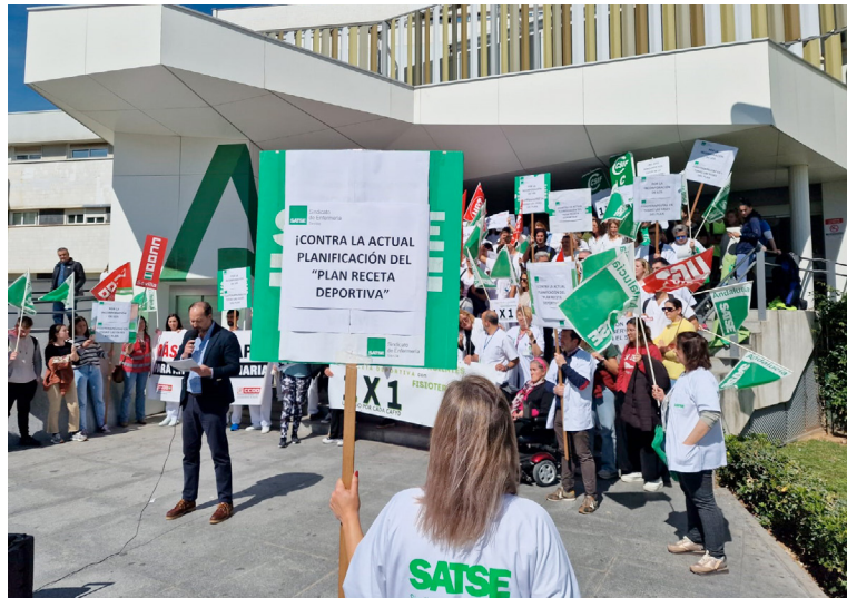
Concentraciones realizadas en Sevilla (arriba) y Canarias (abajo)