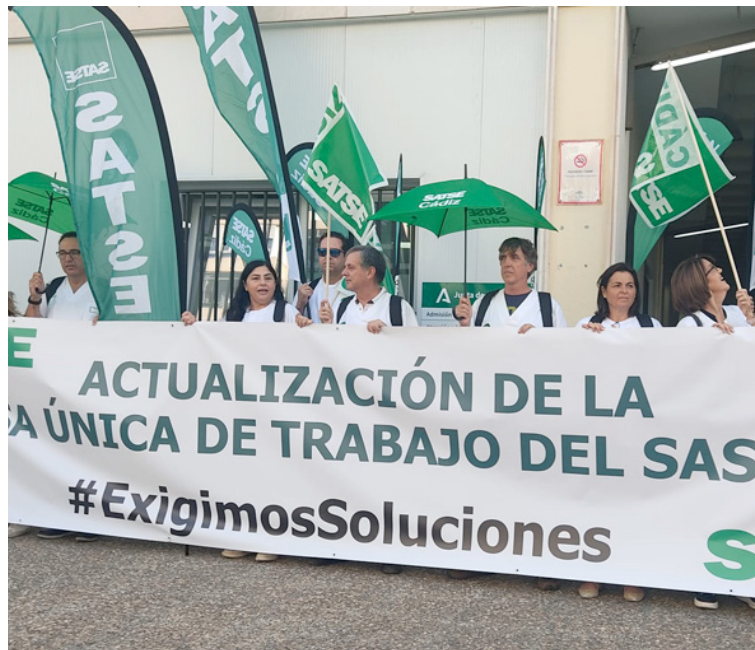
Protesta por la actualización de la Bolsa de Empleo el pasado mes de octubre

Alega el SAS, una vez más para justificar su retraso, "el volumen de personas candidatas que se han presentado, el volumen de méritos a validar y, además, la previsión de las fechas de toma de posesión de las OEP de estabilización, que se están materializando ya, para ir compaginando también las publicaciones y no