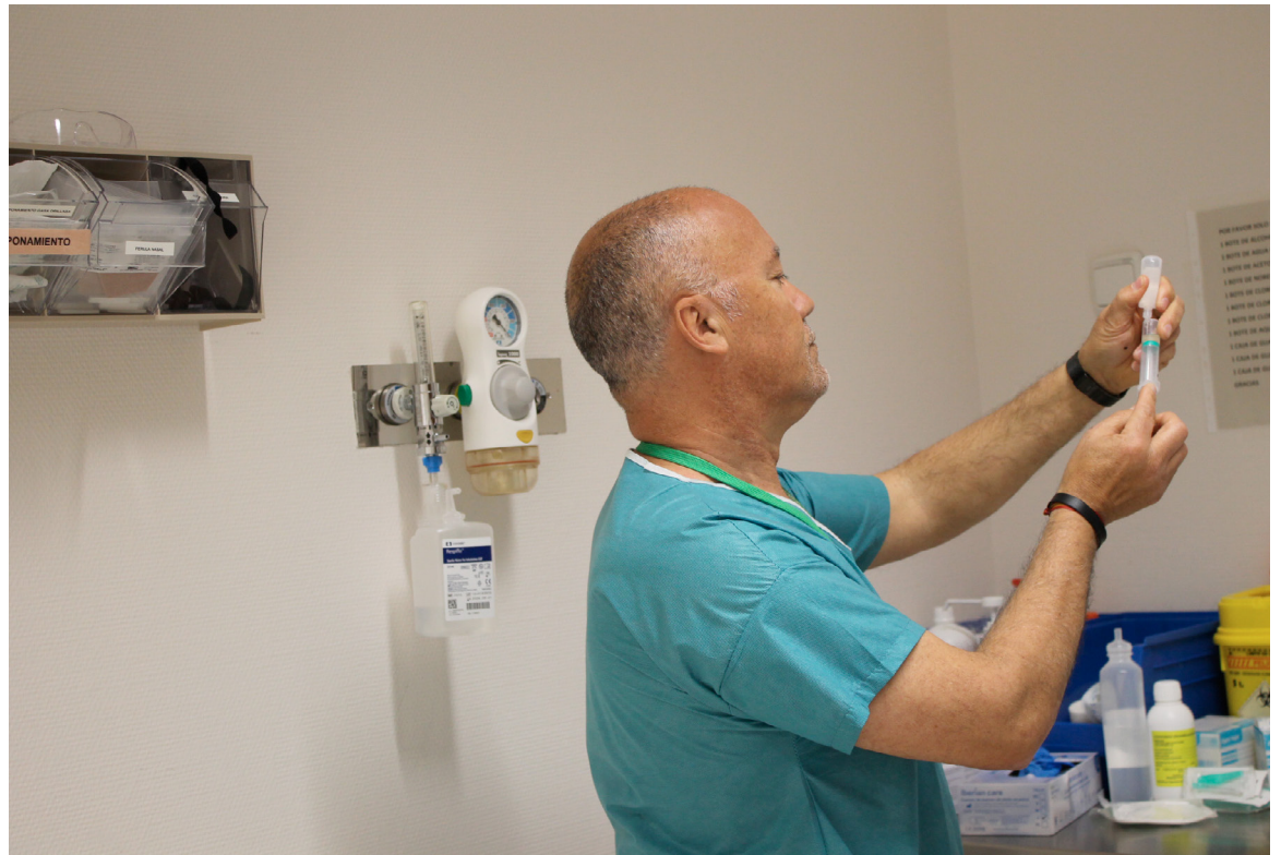
Lograr la jubilación anticipada es una de las prioridades del Sindicato de Enfermería

Desde esa fecha no ha habido ningún avance significativo por parte del Gobierno que se limita a eludir su responsabilidad a pesar de nuestros reiterados requerimientos, apuntan desde la organización sindical.