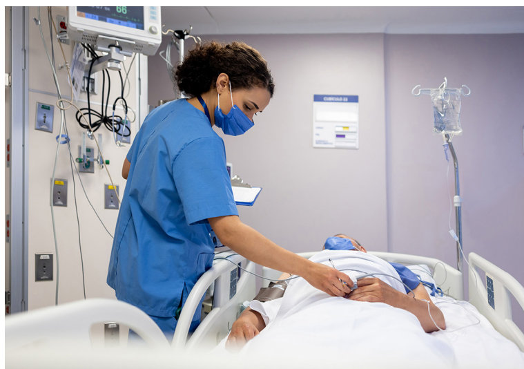
Lograr una igualdad real y efectiva, prioridad de SATSE

Destaca la actualización del Protocolo de Acoso Sexual y por Razón de Sexo que se ha difun-