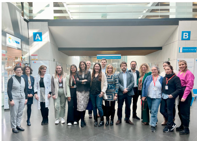
Firmantes del Plan de Igualdad del Hospital de Villalba

La persona trabajadora, se recoge en el acuerdo, queda obligada a actualizar la acreditación de los motivos que justifican la situación de excedencia por cuida-