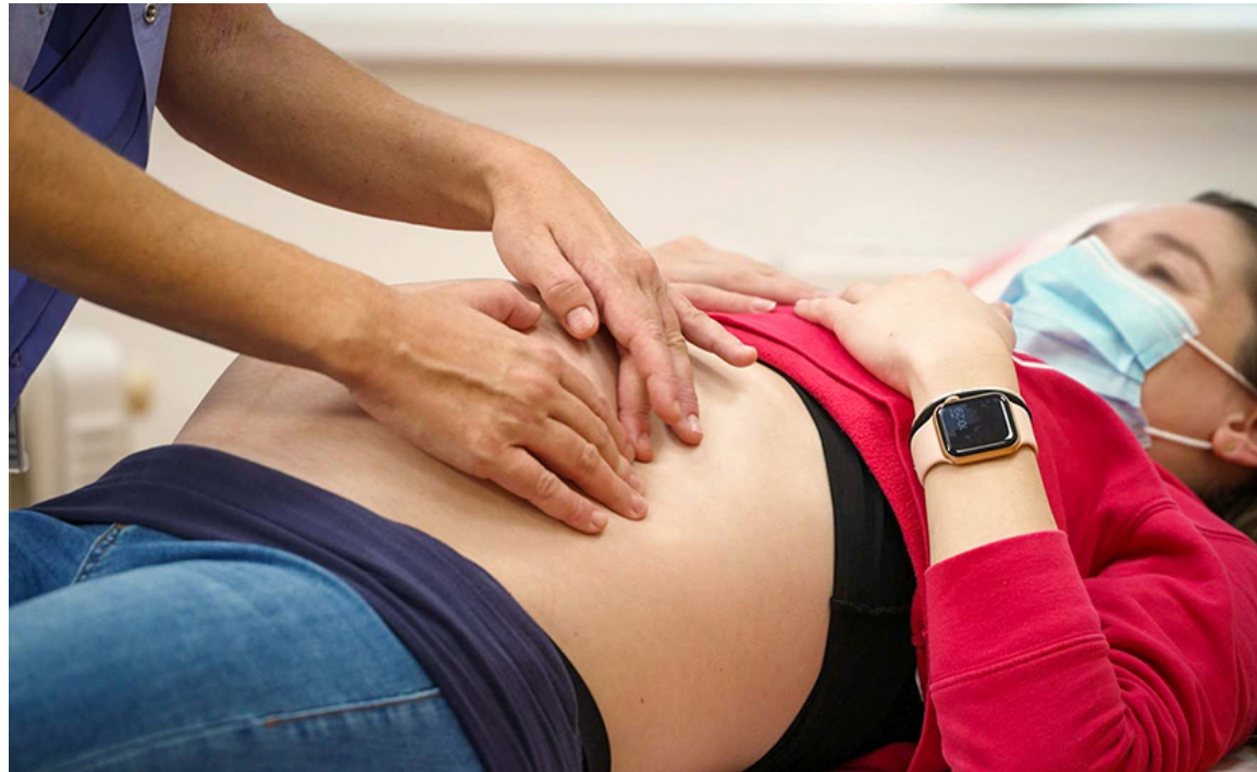
Las matronas del Hospital Universitario de Ceuta realizan una inmejorable labor dentro del servicio

Este aumento ha posibilitado que se cumpla una pretensión antigua del Sindicato de Enfermería, ya que permite disponer de tres enfermeras por la mañana, dos por la tarde y dos por la noche.