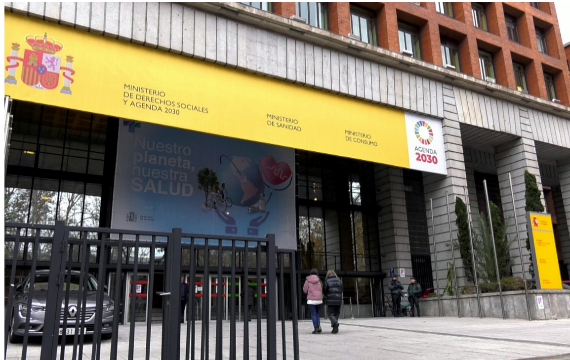
Fachada del Ministerio de Sanidad

Entre otras propuestas, SATSE ha destacado la necesidad de que el Estatuto Marco incluya garantías para una planificación