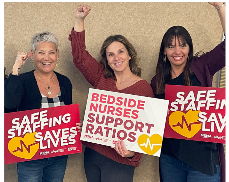
Enfermeras del Estado de Maine (EE.UU)

Esta norma, impulsada por el Sindicato de Enfermería, cuenta con el respaldo de más de 660.000 ciudadanos. ■