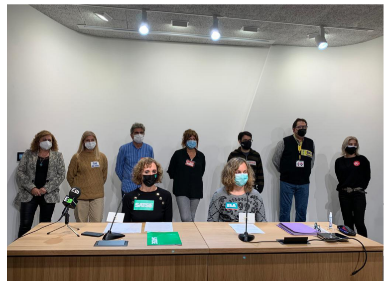
Imagen de los sindicatos convocantes, con la representante de SATSE a la izquierda

Tras una dinámica de movilizaciones sin respuesta, los sindicatos SATSE, ELA, LAB, SME, CCOO, UGT, ESK, SAE Y UTESE han ido más allá. Desde estas organizaciones sindicales consideran urgente poner en marcha soluciones que garanticen el futuro de la sanidad pública y las y los profesionales.