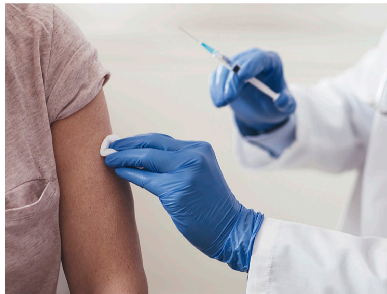
Las enfermeras son las profesionales competentes para administrar las vacunas

Según el Sindicato, lo que ocurre es que estas consejerías de Sanidad no tienen ningún interés en priorizar el cumplimiento de la normativa vigente aunque ello cause perjuicio en la atención sanitaria y cuidados a millones de ciudadanos. Se trata de una tramitación normativa que, en definitiva, lo que conlleva