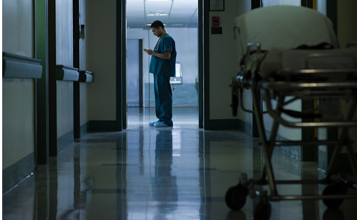
Trabajar por la noche conlleva un innegable desgaste físico, psíquico y emocional para las enfermeras y enfermeros

Unas penosas condiciones laborales que, según el Sindicato, reciben una compensación económica ridícula y absolutamente insuficiente. Así, una enfermera