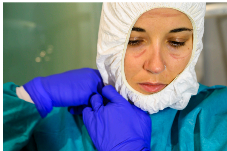
Una de las imágenes de la campaña desarrollada por SATSE Baleares

Las fotos son obra de Javier García, enfermero de Son Espases y fotógrafo profesional, que duran-