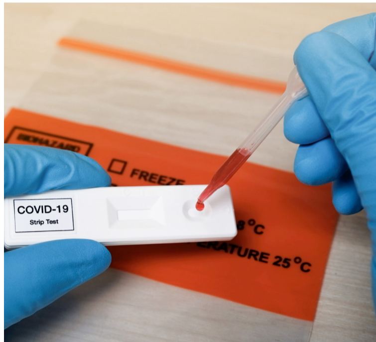
Las farmacias no tienen competencia legal ni formación clínica para realizar los test

SATSE incide, una vez más, que se trata de una prueba diagnóstica que se pretende hacer sin prescripción médica y reitera que debe ser realizada siempre por el personal sanitario que, como las enfermeras, enfermeros u otros