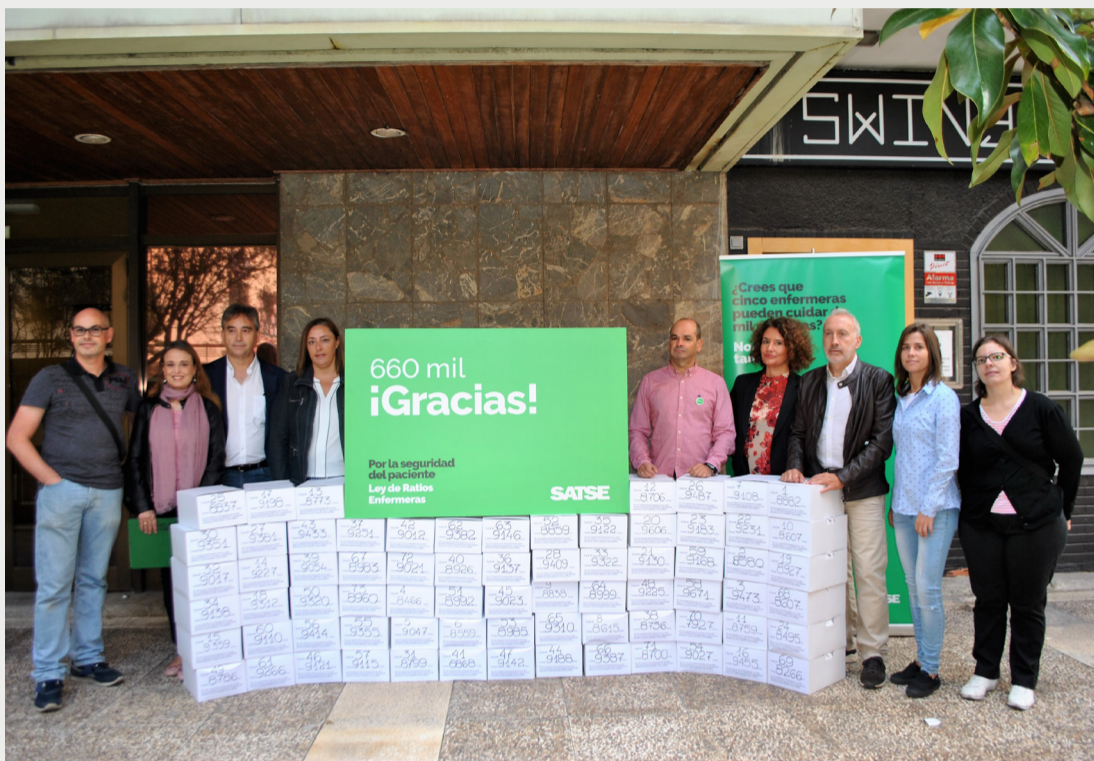
Momento de la presentación de las más de 660.000 firmas que permitieron que la Ley haya entrado en el Congreso

SATSE defiende el beneficio de la Ley a todos los niveles