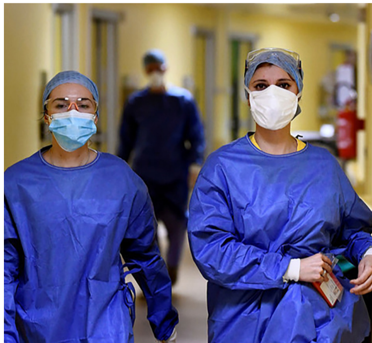
SATSE está comprometido con el desarrollo de políticas en pro de la igualdad

De igual manera, la organización sindical busca el impulso y fomento de medidas para conseguir la igualdad real en el seno de la organización, estableciendo la igualdad de oportunidades en-