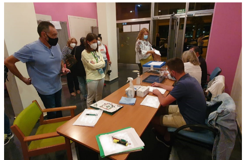
Un momento de las elecciones celebradas en el ERA

Desde el Sindicato se trabajará también para que se mejore la coordinación de tareas entre colectivos dentro de los centros, que se cree una figura enfermera que organice las actuaciones de los equipos de Enfermería por áreas y que se unifiquen los protocolos de trabajo para todos