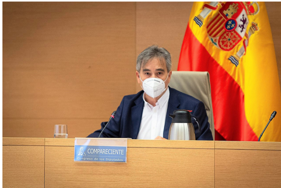
El presidente de SATSE, Manuel Cascos, durante su intervención en la Comisión de Sanidad del Congreso de los Diputados

El presidente de SATSE aseguró que esta Ley es ahora más necesaria que nunca una vez que la grave crisis sanitaria y social provocada por la pandemia de la Covid-19 ha dejado al descu-