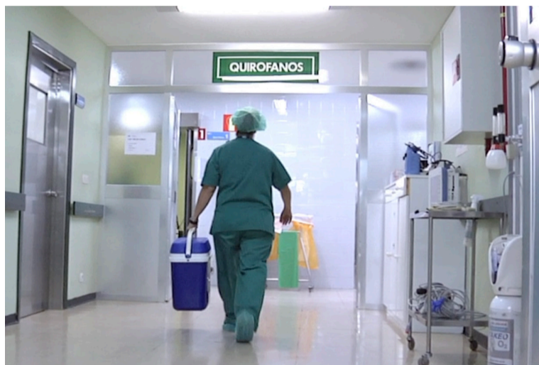
Una enfermera de trasplantes se dirige a los quirófanos

Sin embargo, la buena respuesta del sistema sanitario no parece que vaya a poder evitar que 2020 cierre con un nota-