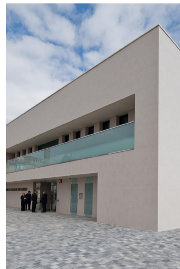
La AP necesita una reestructuración

Para SATSE, que no pone en duda la profesionalidad de este colectivo, la medida viene dada sin un estudio previo de necesidades y funciones que van a desarrollar en los centros de sa-