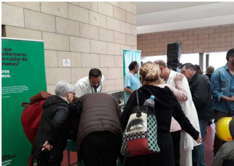
Cientos de miles de personas han apoyado la Ley de Seguridad del Paciente