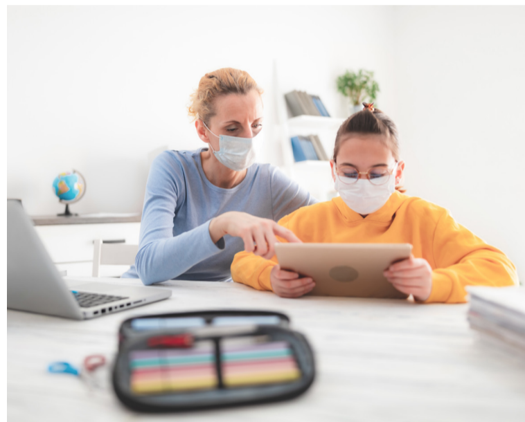
SATSE pide que se cuente con un permiso retribuido a cargo de los empleadores.

En la denuncia realizada ante la Inspección de Trabajo, el Sindicato subraya la situación de desamparo y de riesgo laboral que sufren todos los trabajadores, y en especial los profesionales sanitarios, en los casos de aislamiento o cuarentena de sus hijos