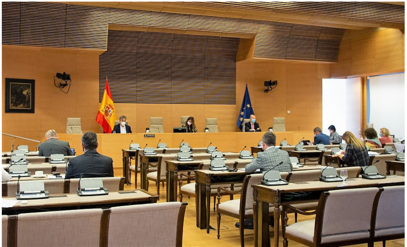
El presidente de SATSE, Manuel Cascos, en un momento de su intervención ante los portavoces de la Comisión de Sanidad del Congreso de los Diputados

Recalcó, además, que es más necesaria que nunca una vez que la grave crisis sanitaria y social provocada por la pandemia de la Covid-19 ha dejado al descubierto que el déficit existente de